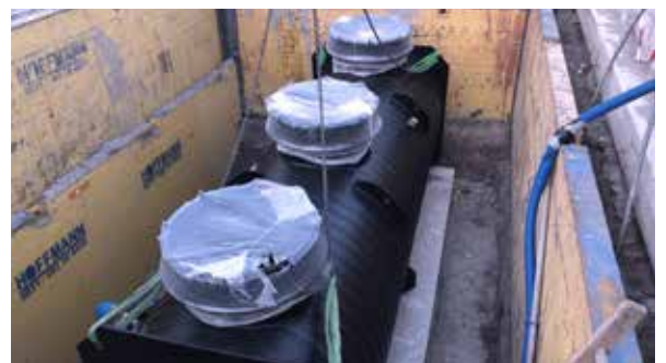
Fettabscheider EasyClean ground Auto Mix & Pump

Vollautomatische Direktentsorgung mit programmgesteuertem Schredder-Mix-System für eine geruchsfreie Entsorgung