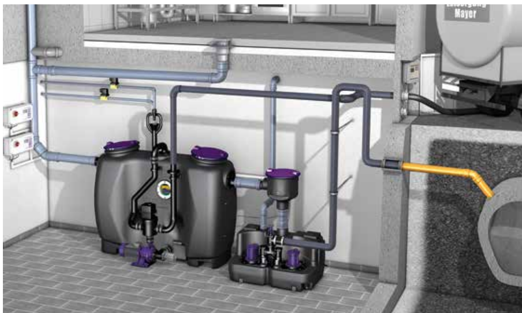
Einbaubeispiel Fettabscheider EasyClean free Auto Mix & Pump NS4 mit Hebeanlage Aqualift F XL