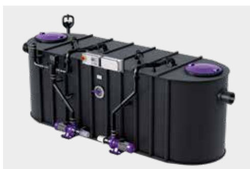
Fettabscheider EasyClean free Auto Mix & Pump

Anpassung und Erweiterung des Abscheidersystems ist jederzeit möglich