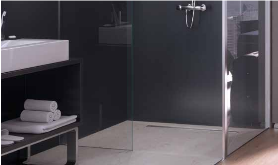
Einbaubeispiel Linearis Compact