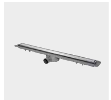
Duschrinne Linearis Compact