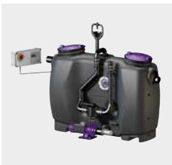
Fettscheider EasyClean free Mix & Pump

Glatte Oberflächen unterstützen den Selbstreinigungseffekt der eingesetzten Duschrinnen