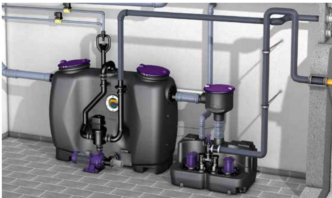
Einbaubeispiel Aqualift F XL Duo