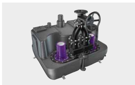
Hebeanlage Aqualift F XL Duo

Das Online-Planungstool SmartSelect macht die Auswahl der am besten geeigneten Lösung ganz einfach.