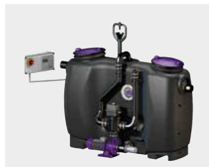
Fettabscheider EasyClean free Mix & Pump