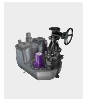
Hebeanlage Aqualift F XL 2001