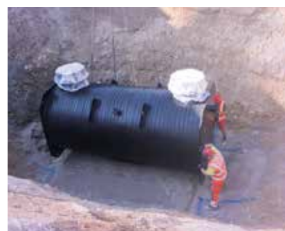
Fettabscheider EasyClean free Auto Mix & Pump NS 40