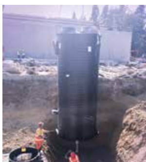
Pumpstation Aqualift S Duo

Weniger Wartungskosten, Energieverbrauch und Verschleiß.