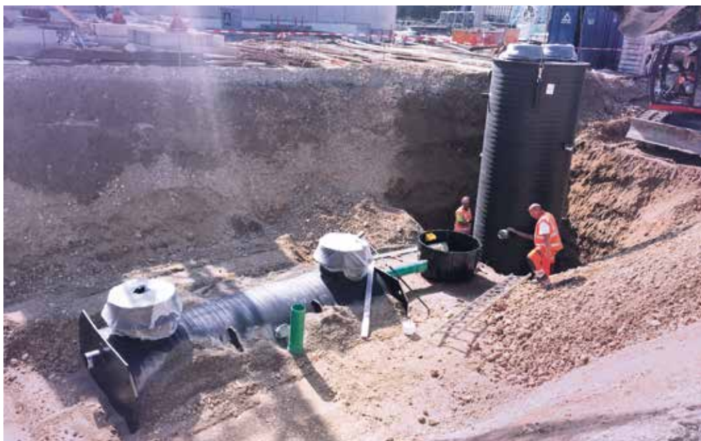
Einbau der Produkte vor Ort