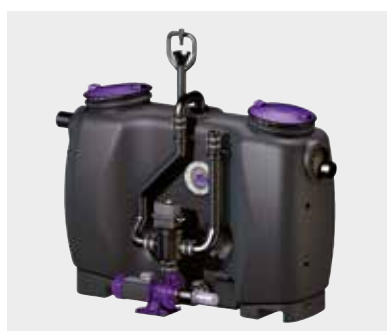
Fettabscheider EasyClean PV