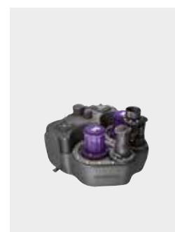
Hebeanlage Aqualift F Duo