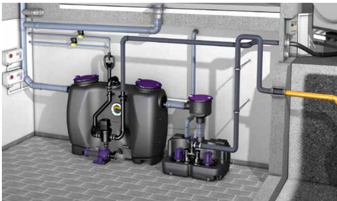
Einbausituation Fettabscheider EasyClean PV

Das Deutsche Theater in München in der Schwantalerstraße wurde 1896 eröffnet. Dieses ist mit seinen rund 1.500 Sitzplätzen und 300 Vorstellungen pro Jahr, das nach der Oper größte Theater in München und das sowohl größte als auch berühmteste Gastspieltheater mit Vollbühne in Deutschland.