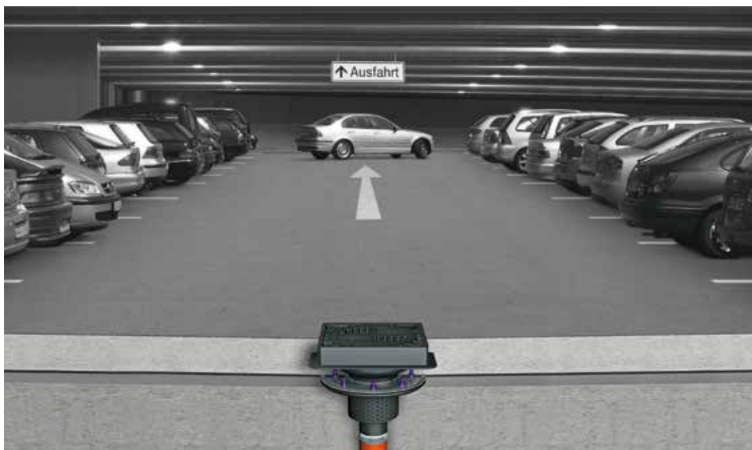
Einbaubeispiel Parkdeckablauf Ecoguss