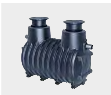
Fettabscheider EasyClean ground NS 15

Modernste Werkstoffe wie Polyethylen und Ecoguss sind sehr haltbar und einfach zu reinigen.