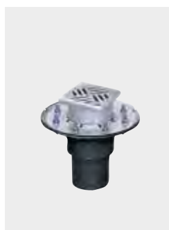
Bodenablauf Ecoguss mit Aufsatzstück