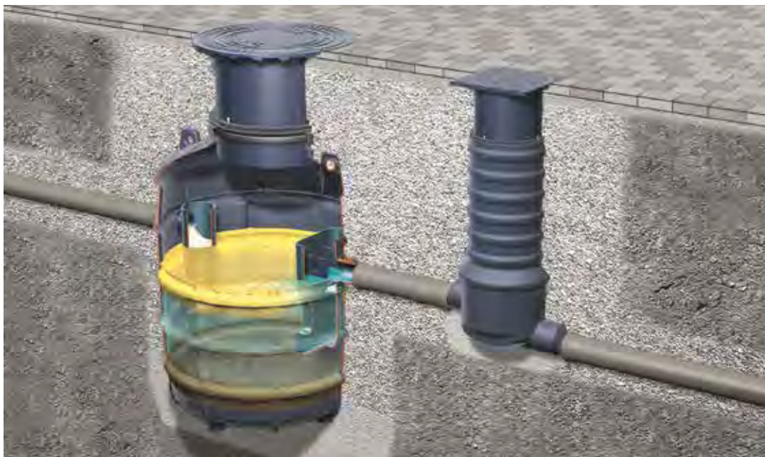
Einbausituation Fettabscheider EasyClean NS 4 mit Probenahmeschacht